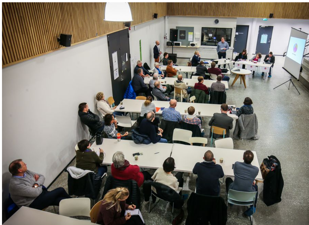
MANGE OPPMØTTE: Folkemøtet ble avholdt på Tromstun skole.

FORSIDE → NYHETER → Folkemøte på fastlandet: – Vi trenger innspill fra Tromsøs befolkning